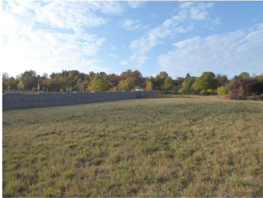
Abbildung 5: Grünland mit Gabione im Osten als Habitat für Eidechsen.

mit Sträuchern und die Gabione im Osten der Teilfläche A (Abbildungen 5 und 6) bieten randlich Versteck- und Sonnenplätze für Eidechsen. Die Grünlandfläche über dem Tunnel ist stark ruderalisiert und sehr jung. Sie weist kein Habitatpotenzial für streng geschützte Arten auf (Abbildung 7).