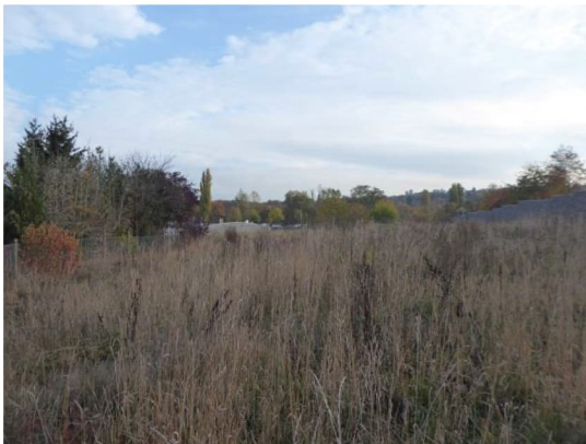
Abbildung 3: Brachfläche (Blick von Südwesten) mit Habitatpotenzial für Eidechsen.

Die Brachfläche und die im Osten angrenzende Gabione bieten ein strukturreiches Habitat für Eidechsen mit Sonn- und Versteckplätzen.