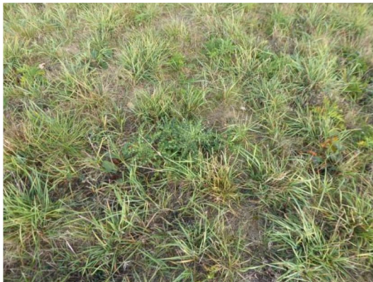
Abbildung 7: Stark ruderalisiertes Grünland mit Kratzdisteln auf dem Flurstück 572/6.

⇒ Die Grünlandfläche, die Gabione, die Sträucher und die hohen Gräser der Brachfläche bieten randlich Habitatpotenzial für Eidechsen.