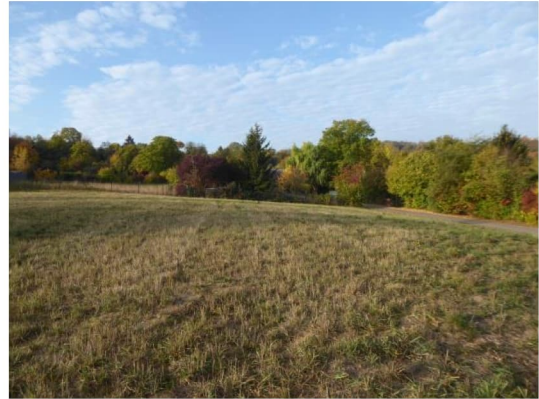
Abbildung 6: Grünland mit Sträuchern und hohen Gräsern im Südwesten als Habitat für Eidechsen.