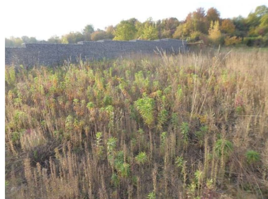
Abbildung 4: Brachfläche (Blick von Norden) mit Habitatpotenzial für Eidechsen.

⇒ Die Brachfläche weist eine Eignung als Habitat für Eidechsen auf.