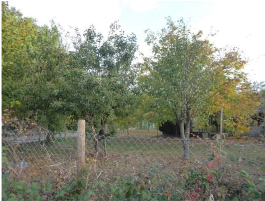
Abbildung 8: Gehölze im Kleingarten als Habitat für Zweigbrüter und Fledermäuse.

Die Gehölze weisen keine Baumhöhlen auf, sodass eine Eignung als Habitat für Totholzkäfer und Höhlenbrüter sowie als Winterquartier für Fledermäuse mit hinreichender Sicherheit ausgeschlossen werden kann. Allerdings können kleinere Spalten in den Bäumen und an den Gartenhäusern von Fledermäusen als Tagesquartiere im Sommer genutzt werden. Außerdem bieten die Gartenhäuser Habitatpotenzial für gebäudebrütende Vogelarten, wie z.B. den Hausrotschwanz.