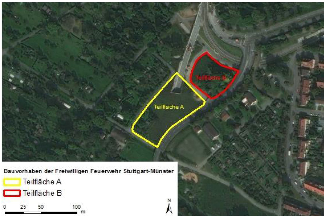
Abbildung 2: Lage der Teilflächen für den Bau eines Feuerwehrhauses in Stuttgart-Münster

Die Standorte werden gemäß der naturräumlichen Gliederung (HUTTENLOCHER & DONGUS 1967) dem Naturraum Neckarbecken zugeordnet. In diesem Naturraum liegt der Eingriffsbereich in der Untereinheit Marbach-Waiblinger Täler .