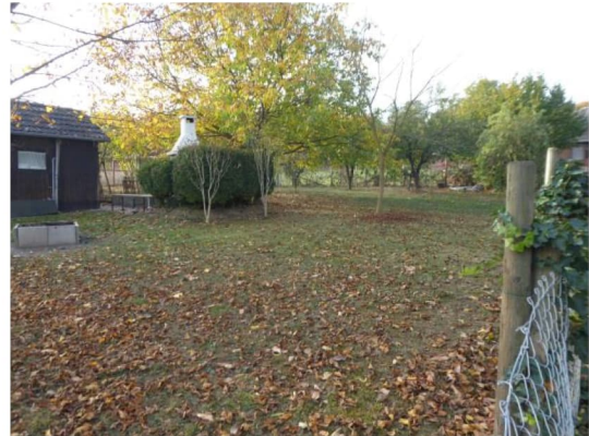
Abbildung 9: Gehölze und Gartenhäuser im Kleingarten als Habitat für Zweig- und Gebäudebrüter sowie für Fledermäuse.

⇒ Der Kleingarten weist eine Eignung für Fledermäuse, Zweig- und Gebäudebrüter und Haselmäuse auf.