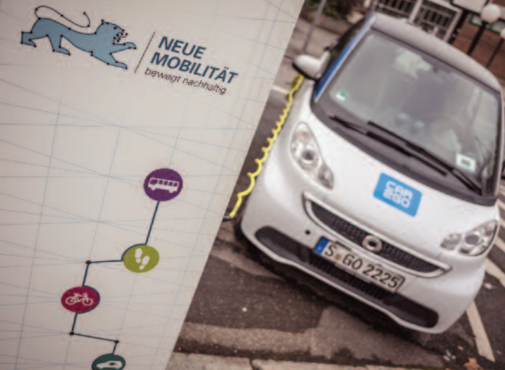
Gute Alternative: Bei Feinstaubalarm auf E-Autos umsteigen.