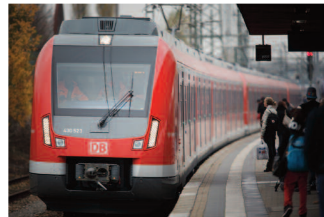
Unterwegs mit Bus und Bahn: Mit der polygoCard können Umsteiger die Mobilitäts-Angebote einfacher kombinieren.