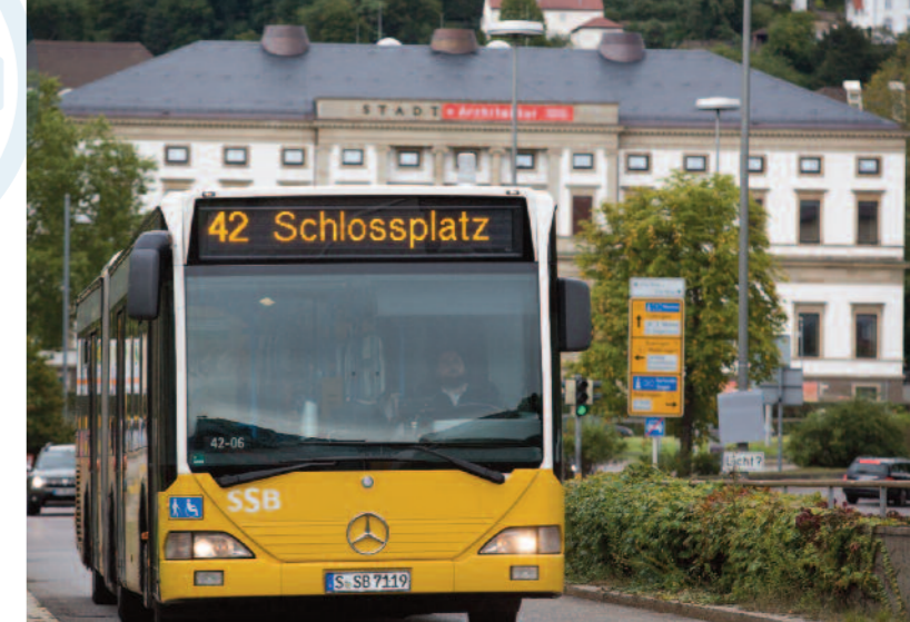
Bei Feinstaubalarm erste Wahl: öffentliche Verkehrsmittel.