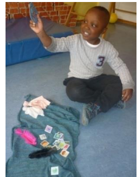
Abb.4: Entwicklung einer Geschichte, „Foto: Stadt Stuttgart“

Unsere Kitaintegrierte Praxisberatung (kurz KiP-Kommunal) erzählt den Kindern regelmäßig Märchen. Durch Zuhören entstehen bei Kindern innere Bilder und Assoziationen, die ihre Fantasie beflügeln. Daraus entwickeln die Kinder ihre eigenen Geschichten und Identifikationsfiguren, mit denen sie Erlebnisse bearbeiten. Darauf aufbauend hat unsere KiP-Kommunal einen Märchenkoffer eingeführt. Immer ein Kind darf aus dem Märchenkoffer drei kleine