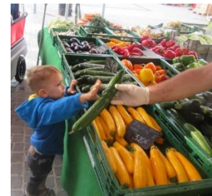
Abb. 14: Einkaufen auf dem Wochenmarkt, Kleinkindbereich

Seit 2012 haben wir, vermittelt über den Verein Future 4 Kids e.V., einen „Paten“, die Firma Pets Nature in Fellbach, die es uns finanziell ermöglicht, mindestens einmal in der Woche in jedem Altersbereich gemeinsam mit den Kindern ein gesundes Frühstück zu zubereiten. In der Regel gehen wir mit den Kindern am Tag vorher einkaufen, zum Bäcker um die Ecke, auf den Wochenmarkt direkt vor unserer Tür und/oder zum Supermarkt. Wir legen dabei in erster Linie Wert auf regionales, frisches Obst und Gemüse am liebsten in Bioqualität, Vollkornprodukte und Biomilchprodukte. Je nach Frühstücksangebot werden die Lebensmittel am Vortag bzw. am Frühstücksmorgen meist zusammen mit den Kindern zubereitet. Die Kinder lernen dabei die Lebensmittel, deren Zubereitung und den Umgang mit Küchenutensilien kennen.