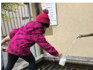
Abb. 15: Wir holen Mineralwasser am Polizeibrunnen, GTE-Bereich, „Foto: Stadt Stuttgart“

Die zentrale Lage unserer Kita hat den Vorteil, die vielfachen Sehenswürdigkeiten (Wilhelma, Naturkundemuseum, Stadtmuseum etc.), Grünflächen (Kur- und Rosensteinpark), Spielplätze in kürzester Zeit mit unseren Kindergruppen zu erreichen. Bad