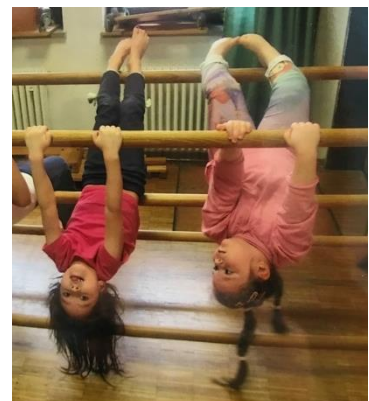
Abb.5: Bewegungsraum, VÖ-Kiga, „Foto: Stadt Stuttgart“

Des Weiteren bieten unsere Fachkräfte für Bewegungserziehung den Kindern vielfältige Bewegungs- und Spielmöglichkeiten, u.a. (Fuß)Ball oder Fangspiele, Tanzen, Bewegungs- und Kletterparcours oder auch Hüpfspiele, für eine gute psychomotorische Entwicklung an. Besonders hervorheben lässt sich zudem noch, dass wir jährlich an einem Fußballturnier mit anderen Einrichtungen aus dem Stadtbezirk teilnehmen.