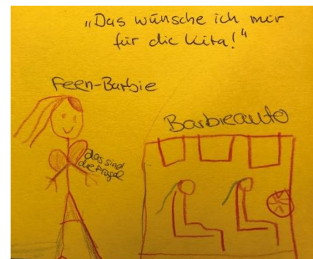
Abb.2: Wunschezettel eines Kindes

Wie gehen wir aber damit um, wenn z.B. Kinder das Bedürfnis haben bei kaltem Wetter ohne Jacke in den Garten zu gehen? Und lassen wir die Kinder auch mitbestimmen bzw. beteiligen wir sie an Entscheidungen, die die Kita betreffen? Wir, die Fachkräfte, die Kinder und die Eltern möchten und haben uns bereits auf den Weg gemacht, unter Berücksichtigung der Rahmenbedingungen, zusammen gemeinsame Entscheidungen für unsere Kita zu treffen. Wir sehen es als Prozess an, bei dem wir stets unsere Entscheidungen hinterfragen und reflektieren möchten, um nicht in scheinpartizipatorisches Verhalten zu fallen.