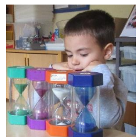
Abb.7: "Wie schnell vergeht die Zeit?", VÖ-Kiga, „Foto: Stadt Stuttgart“

Im Altersbereich 3-6 Jahre liegt der Fokus bei Mengenverständnis, erstes Zahlen kennenlernen, geometrische Formen erkennen, Materialien kategorisieren und sortieren. Auch in Verbindung mit mathematischen Begriffen, wie kürzer, länger, hoch und tief oder mehr und weniger. Für die Kinder bieten wir verschiedenste Utensilien an, um ihre mathematischen Fähigkeiten ganzheitlich zu fördern. Zum Beispiel Würfelspiele, Bauklötze, Rechenschieber, Magnetzähltafeln, Taschenrechner, etc. Zum Messen stellen wir Waagen, Meterstäbe und Wasserwaagen zur Verfügung. Auch während Kinderrunden führen wir unterschiedliche Fingerspiele und Zahlenlieder ein.