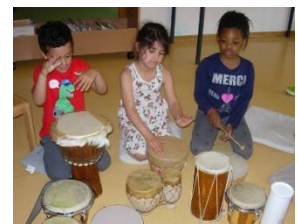
Abb. 12: Trommelangebot, GTE, „Foto: Stadt Stuttgart“

Im Altersbereich 3-6 haben wir mehrere musikalisch geschulte Mitarbeiter die die Kinder z.B. in der Morgenrunde mit der Gitarre oder dem Klavier begleiten. Die Kinder haben regelmäßig