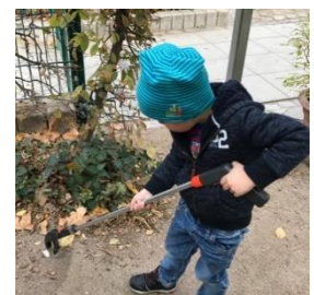
Abb.9: „Kann ich bitte die Müllhände haben?“ GTE, „Foto: Stadt Stuttgart“