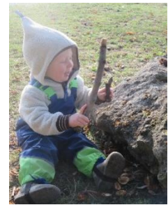
Abb.8: Ausflug im Park, Kleinkindbereich

Richard Louv, 2011, Das letzte Kind im Wald