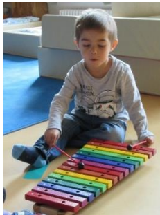
Abb. 11: Erste Erfahrung mit Instrumenten, Kleinkindbereich, „Foto: Stadt Stuttgart“

Eine Sache ist in allen Ländern der Welt sehr ähnlich, nämlich, dass Musik verbindet. Lieder und Tänze vermitteln ein Gefühl von Zusammengehörigkeit und geben dem Erlebten Emotionen. Musik ist bei uns in der Kita allgegenwärtig und begleitet uns