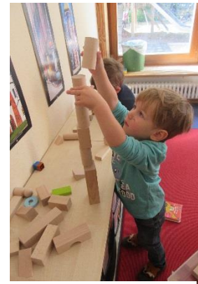
Abb.6: Ein Turm entsteht, Kleinkindbereich, „Foto: Stadt Stuttgart“

Im Altersbereich 3-6 Jahre liegt der Schwerpunkt in der Förderung der Motorik, dem räumlichen Verständnis, der Architektur, der Sinneserfahrung und dem sozialen Miteinander. Dabei bieten wir ähnlich wie im Kleinkindbereich verschiedene Materialien, wie Magnete, Lego-, Holz- und Duplo-Bausteine, sowie Holzschienen, verschiedene Murelbahnen, Naturmaterialien etc. an. So haben die Kinder vielfältigste Möglichkeiten ihre Phantasie voll auszuschöpfen und ihre aktuellen Themen zu bearbeiten. Nebenbei lernen die Kinder durch Effekte wie Versuch und Irrtum oder durch Abschauen und Vergleichen, wie Konstrukte auch dreidimensional erbaut werden können. So wachsen mit zunehmenden Alter nicht nur die Kinder und ihre Erfahrungen, sondern auch ihre Bauwerke, von zufällig aneinandergereihten Klötzen zu komplexen Konstruktionen, bei denen jedes Element eine bestimmte Funktion erfüllt.