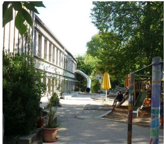
Abb. 1: „Foto: Stadt Stuttgart“

Kinder- und Familienzentrum Helfergasse 2/10-12 70372 Stuttgart-Bad Cannstatt Telefon: 07161/216-91579 Email: te.helfergasse@stuttgart.de Homepage: https://www.stuttgart.de/kita-helfergasse