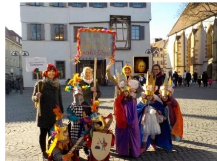
Abb.3: Cannstatter Kinderfaschingsumzug gemeinsam mit Eltern 2018, „Foto: Stadt Stuttgart“

Es finden verschiedene Elternaktionen im gesamten Kitajahr statt: Ein Einführungselternabend, ein Themenelternabend, Beteiligung an Konzeptionstagen, Teilnahme an Jahreszeitenfesten und dem Sommerfest, Beteiligung und Mitgestaltung an Ausflügen und Veranstaltungen, Elterncafés und Elternfrühstücke.