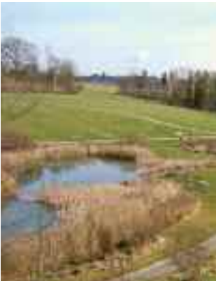
Botanischer Garten Hohenheim