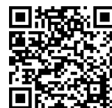
Bild Titelseite: © Getty Images/Henglein and Steets Bild Innenseite: © VVS

Druck: klimaneutral auf 100 % Recyclingpapier Stand: September 2025