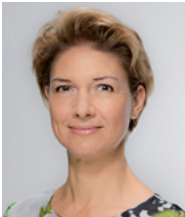
Dr. Alexandra Sußmann Bürgermeisterin für Soziales und gesellschaftliche Integration

Wir begrüßen Sie herzlich zu „Kino ganz nah – 1. Stuttgarter Filmfest der Generationen“, das erstmalig und in dieser Form neu in Stuttgart vom 17. September bis zum 30. November 2023 stattfindet. Bisher koordinierte das Gesundheitsamt der Landeshauptstadt Stuttgart die zahlreichen Veranstaltungen im Rahmen des Europäischen Filmfestivals der Generationen. Ab diesem Jahr nun wird das neue Filmfest „Kino ganz nah“ vom Gesundheitsamt in Kooperation mit dem Verein Haus für Film und Medien Stuttgart e.V. (HFM) durchgeführt.