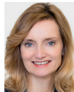
Bürgermeisterin Isabel Fezer (FDP)