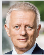
Oberbürgermeister Fritz Kuhn (BÜNDNIS 90/DIE GRÜNEN) im Amt seit Januar 2013