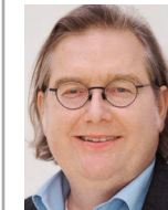
Bürgermeister Peter Pätzold (BÜNDNIS 90/DIE GRÜNEN)