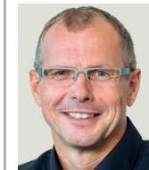
Bürgermeister Dirk Thürnau (SPD)