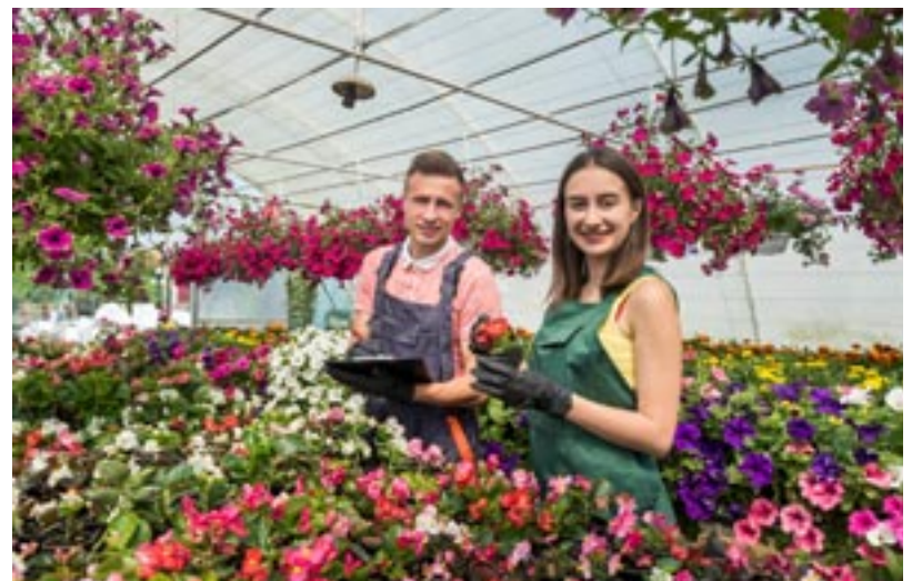
In der Gärtnerei werden Pflanzen gezüchtet und für den Verkauf vorbereitet.