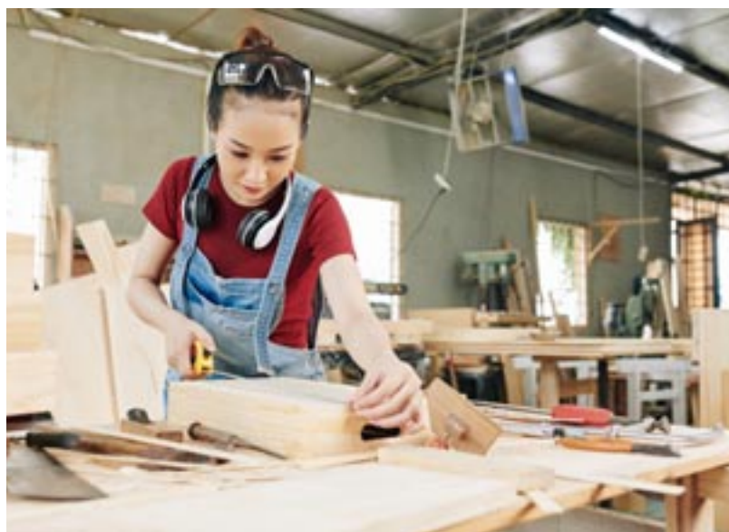
In der Schreinerei werden Möbel und Innenausbauten hergestellt.

Ziel: staatlich geprüfte/-r Assistent/-in